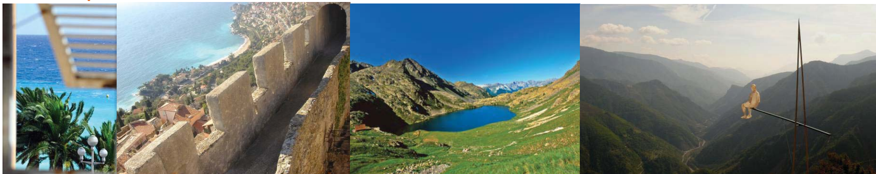
@CRT Côte d'Azur – Roquebrune Cap Martin - Conseil général des Alpes-Maritimes –Arboretum de Roure